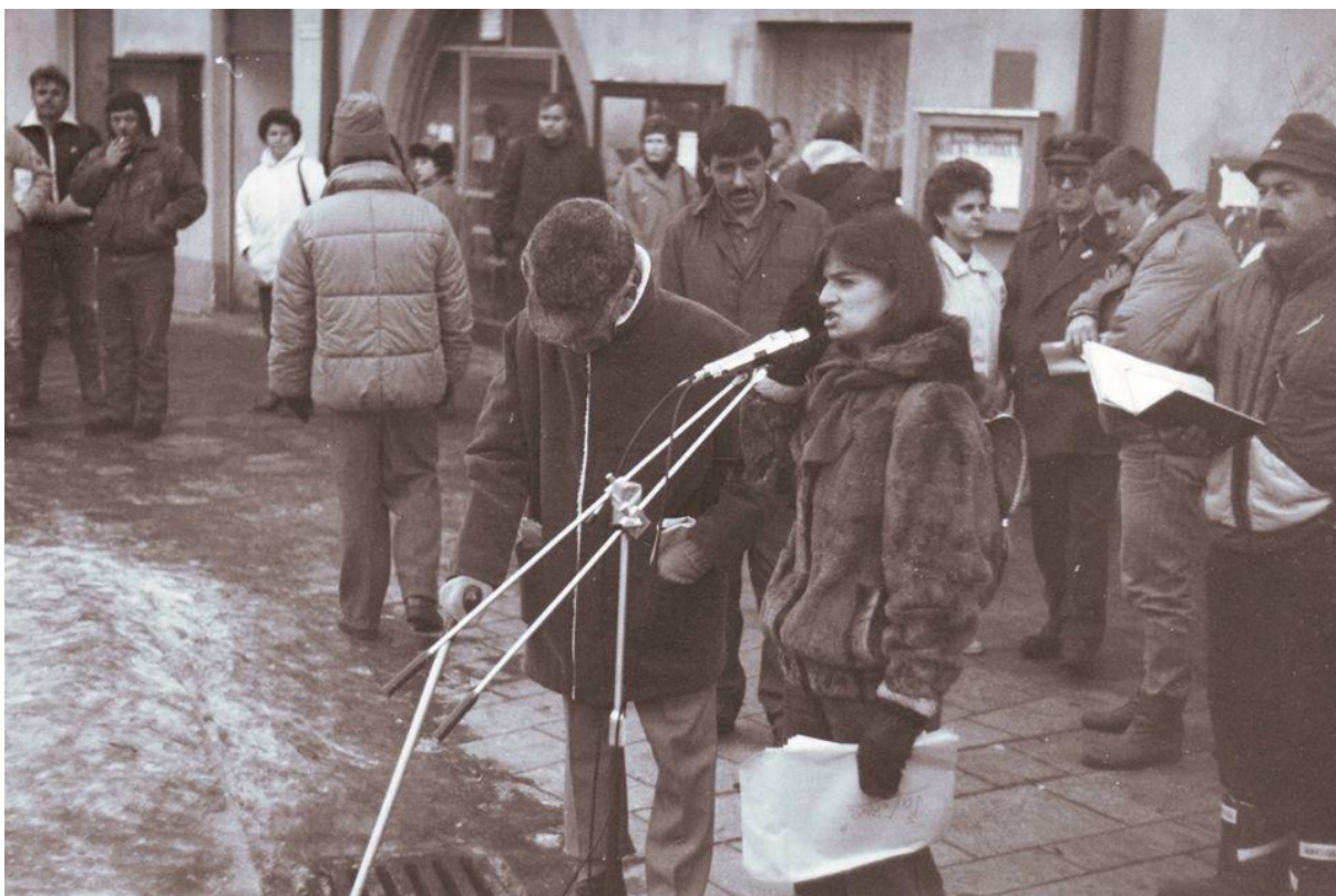
Fotografie z odpolední demonstrace 27. 11. v Tachově - informace a rozmnožené materiály přiváželi studenti.