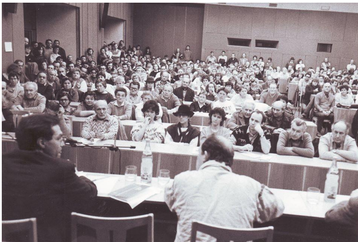
Fotografie jednoho z "Dialogů", které pořádalo tachovské OF v zasedacím sále OV KSČ - dnes kino Mže.

Tachovská Jiskra 8. 12. - "Požadavek dalších změn vlády" - pokračování článku.