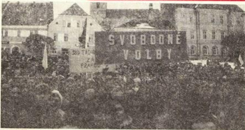
V pondělí 27. listopadu se od 12 do 13.30 hodin uskutečnila na náměstí okresního města generální stávka podporující požadavky pražských studentů a svazáků. Zúčastnili se jí také někteří pracující závodů a podniků i dalších institucí.

ORGAN OKRESNÍHO VÝBORU KSČ A ONV V TACHOVĚ Číslo 48 • Ročník XL • Cena 40 haléřů • 1. prosince 1989