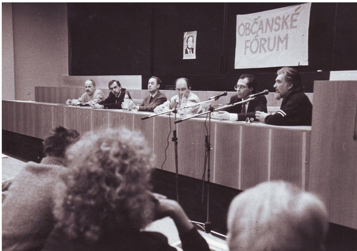
Fotografie z "Dialogu" 13. 12. 1989 - pohled na předsednictvo.