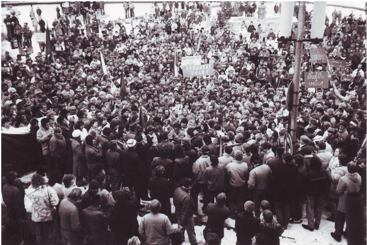
Fotografie z Generální stávký 27. 11. dopoledne - náměstí Tachov.