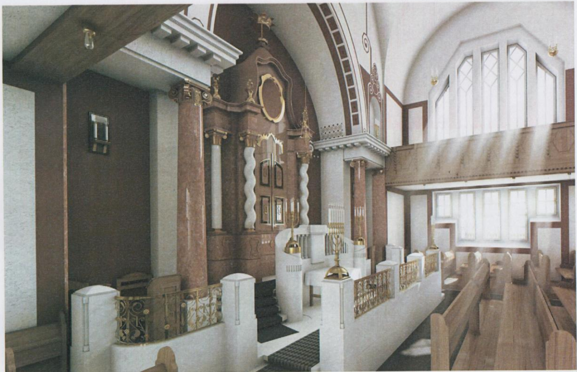
Interiér synagogy – vizualizace