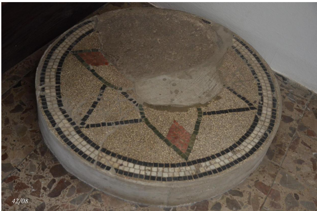
Mozaika z podlahy synagogy – dnes v muzeu