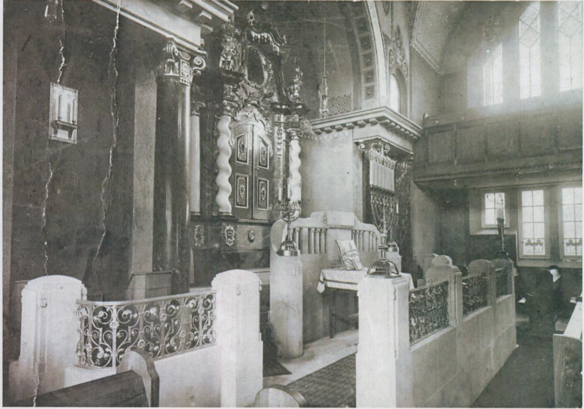
Interiér synagogy – dobová fotografie