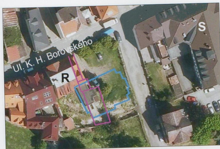
Obr. 5: Poloha staré (fialově) a nové (modře) synagogy zakreslená do současného leteckého snímku (R - rabinský dům, S - spořitelna) ( http://www.mapy.cz )