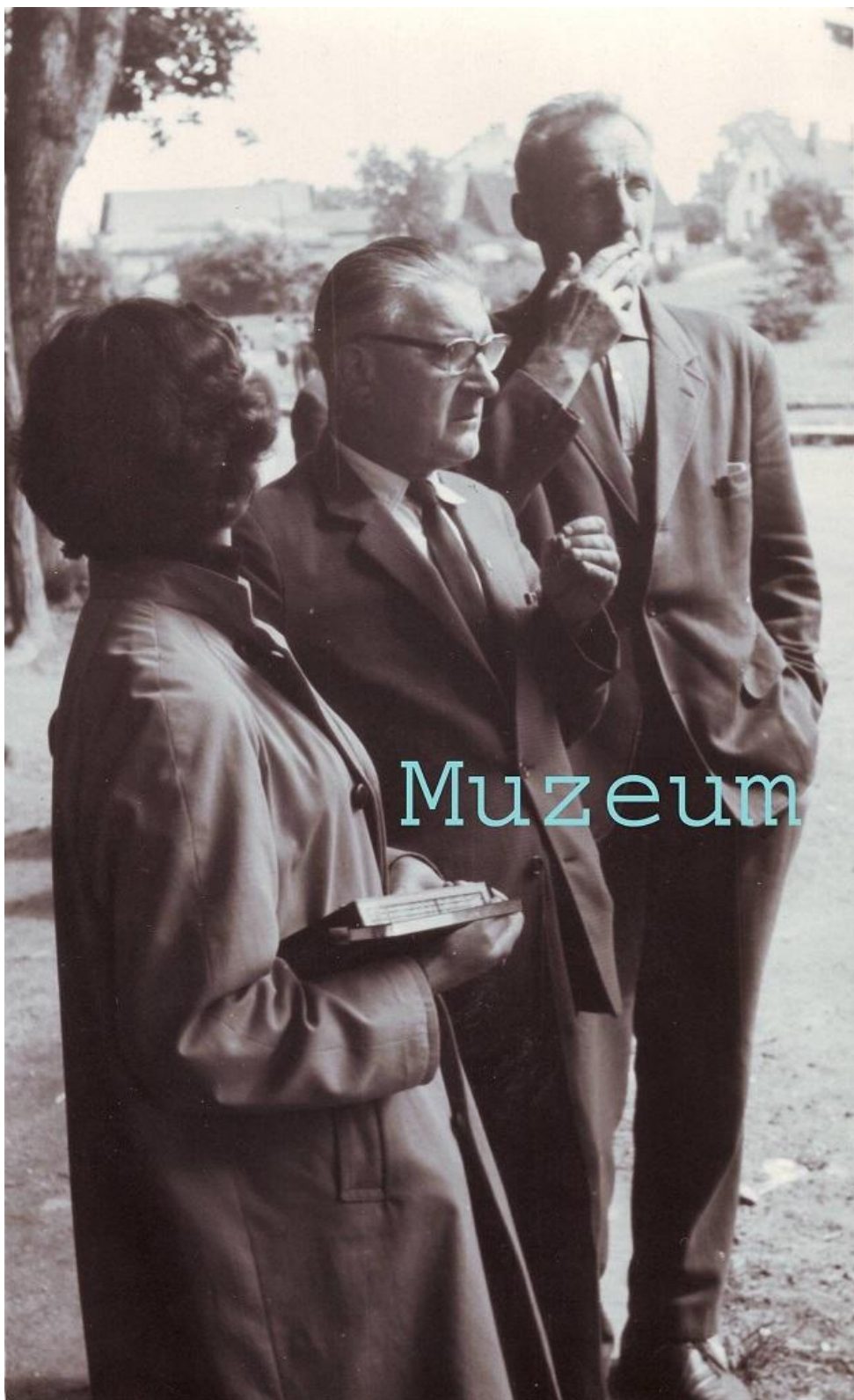
Napínavý poslech rozhlasu 21.8.