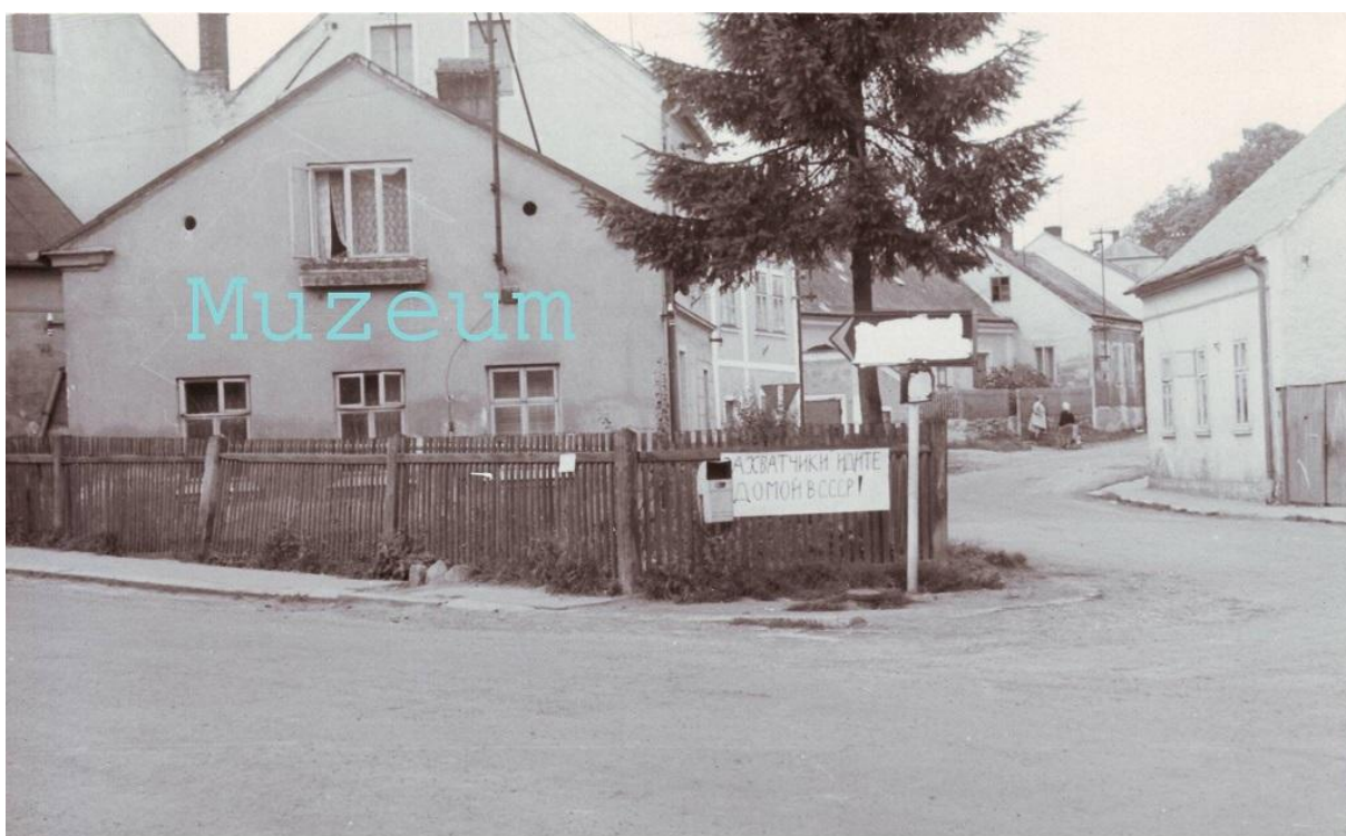
„Úprava“ silničního značení