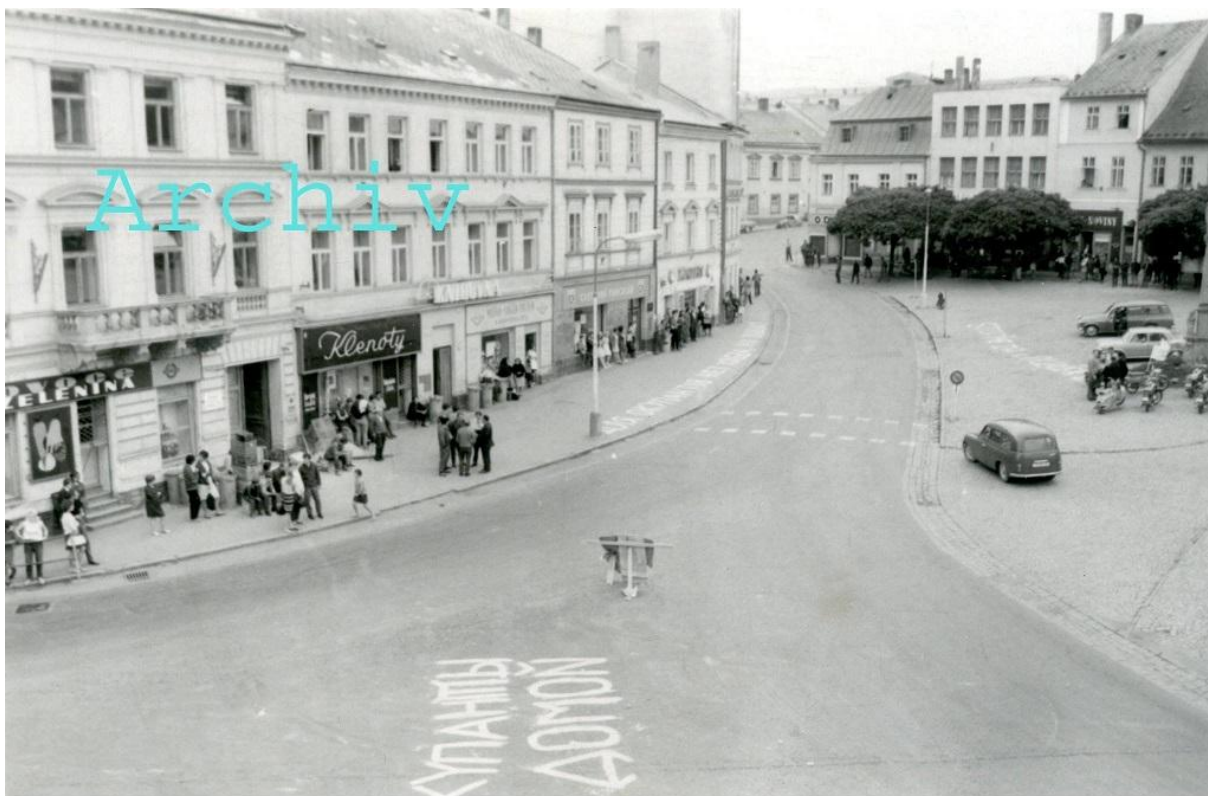
Náměstí s nápisy na silnici