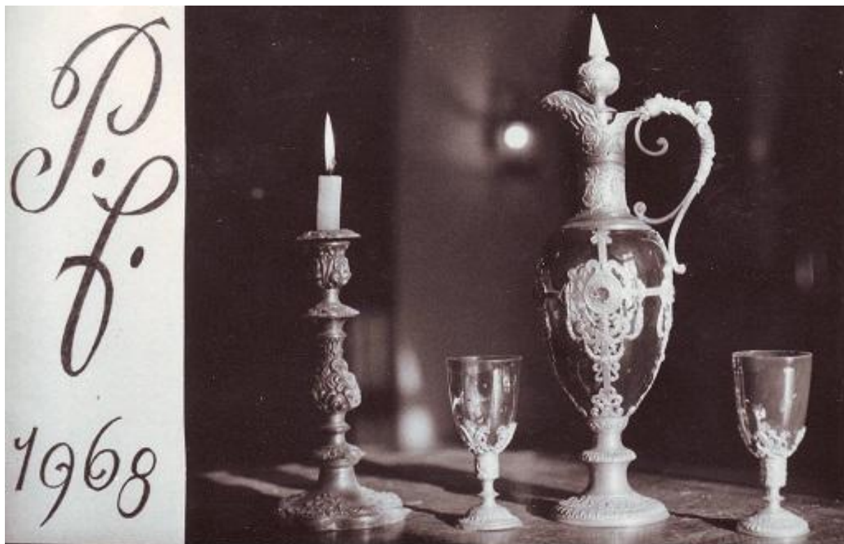
PF muzea za využití sbírkových předmětů