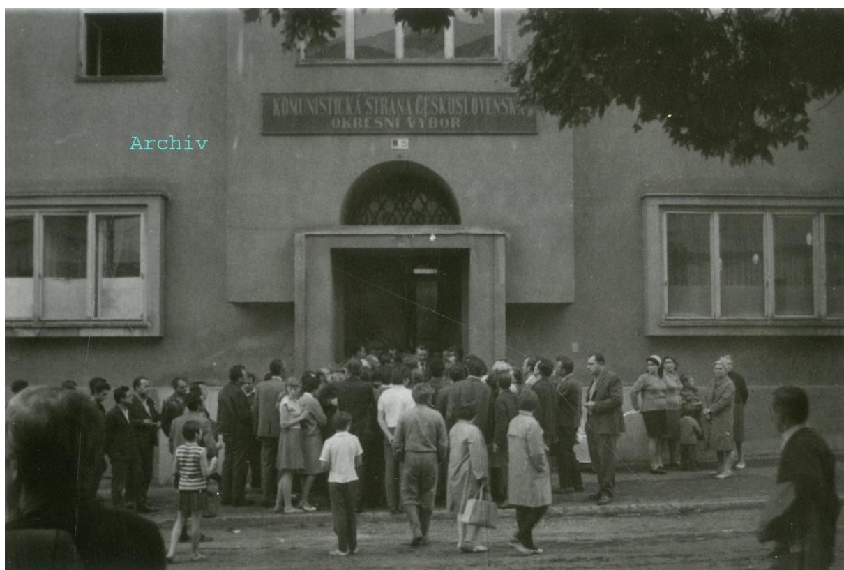
Před budovou OV KSČ po příjezdu s. Černého z Brna