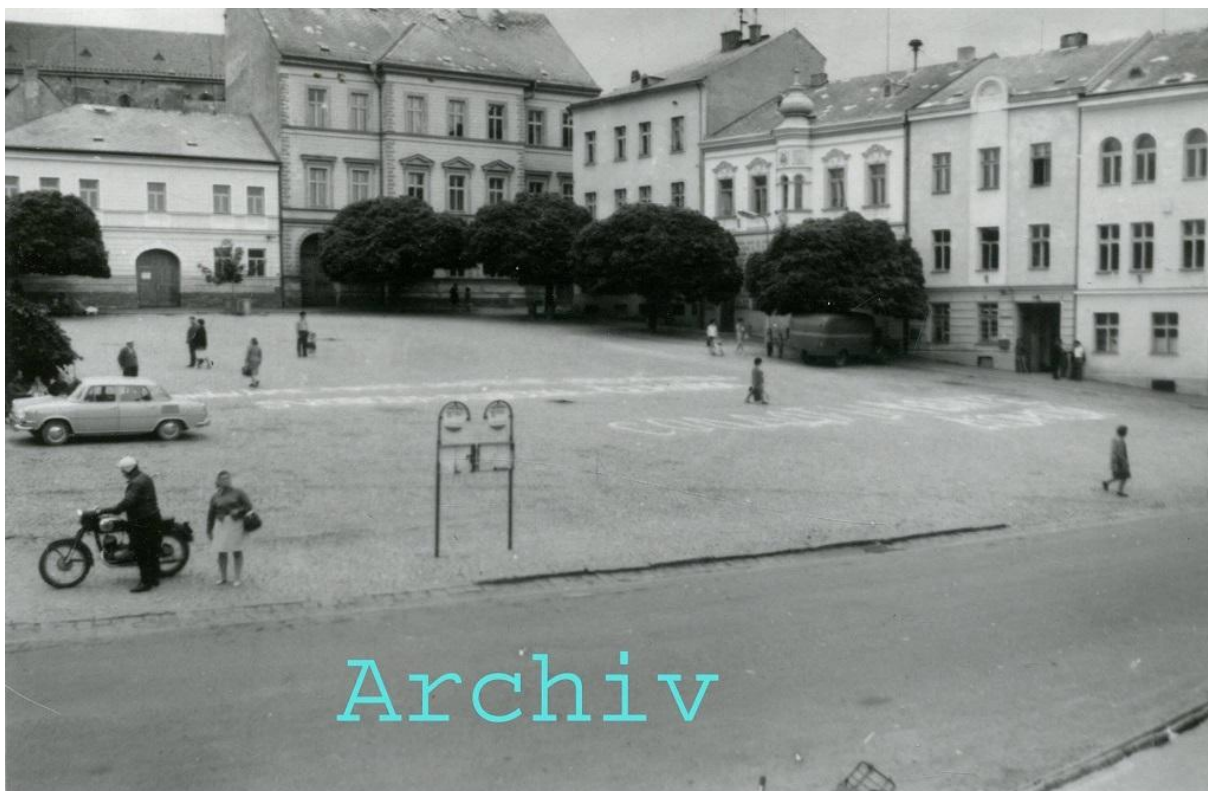
22. 8. – náměstí a nápisy