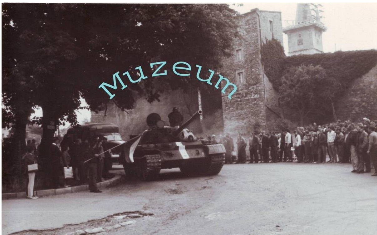
Tank v Zámecké ul.