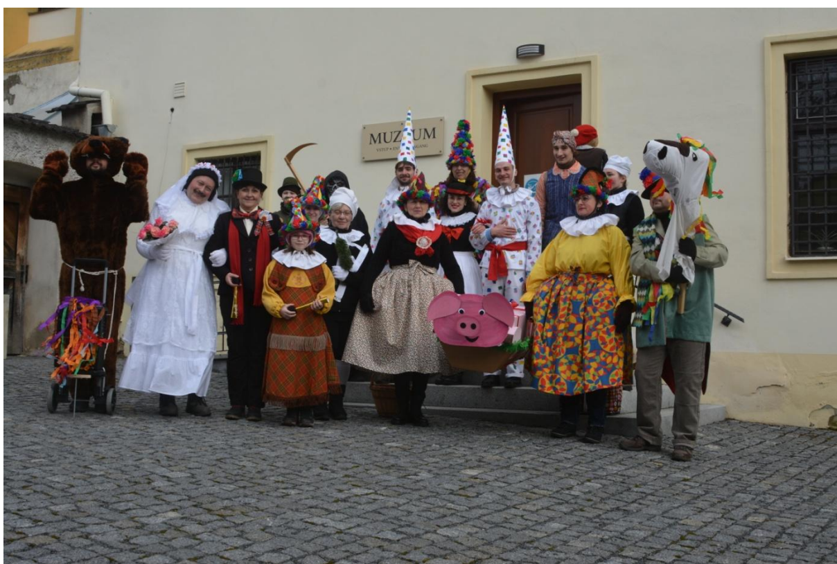
Masopust 2022 – muzejní zaměstnanci a přátelé

Je potěšující, že do těchto muzejně ne zcela tradičních aktivit se pracovníci ochotně zapojují bez ohledu na jejich pracovní zařazení. Spolu s oživením spolupráce se školami a spolky to vzbuzuje naději do dalších muzejních let.