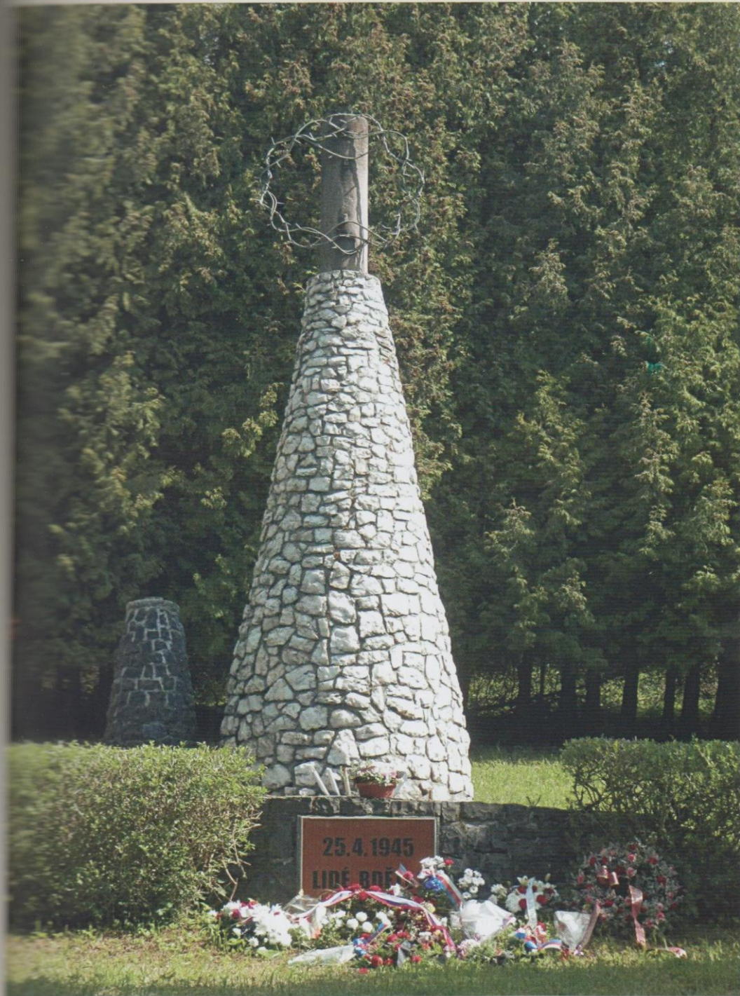
Památník pochodu smrti (s chybným datem), na který zaútočili hloubkaři u Pístova