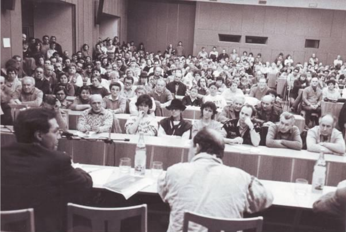
Fotografie jednoho z "Dialogů", které pořádalo tachovské OF v zasedacím sále OV KSČ - dnes kino Mže.

Tachovská Jiskra z 1. 12. - "Stávky a dialogy na ulici nic nevyřeší" - pokračování článku. Tachovská Jiskra byl týdeník. Toto číslo tedy mělo uzávěrku ještě před generální stávkou.