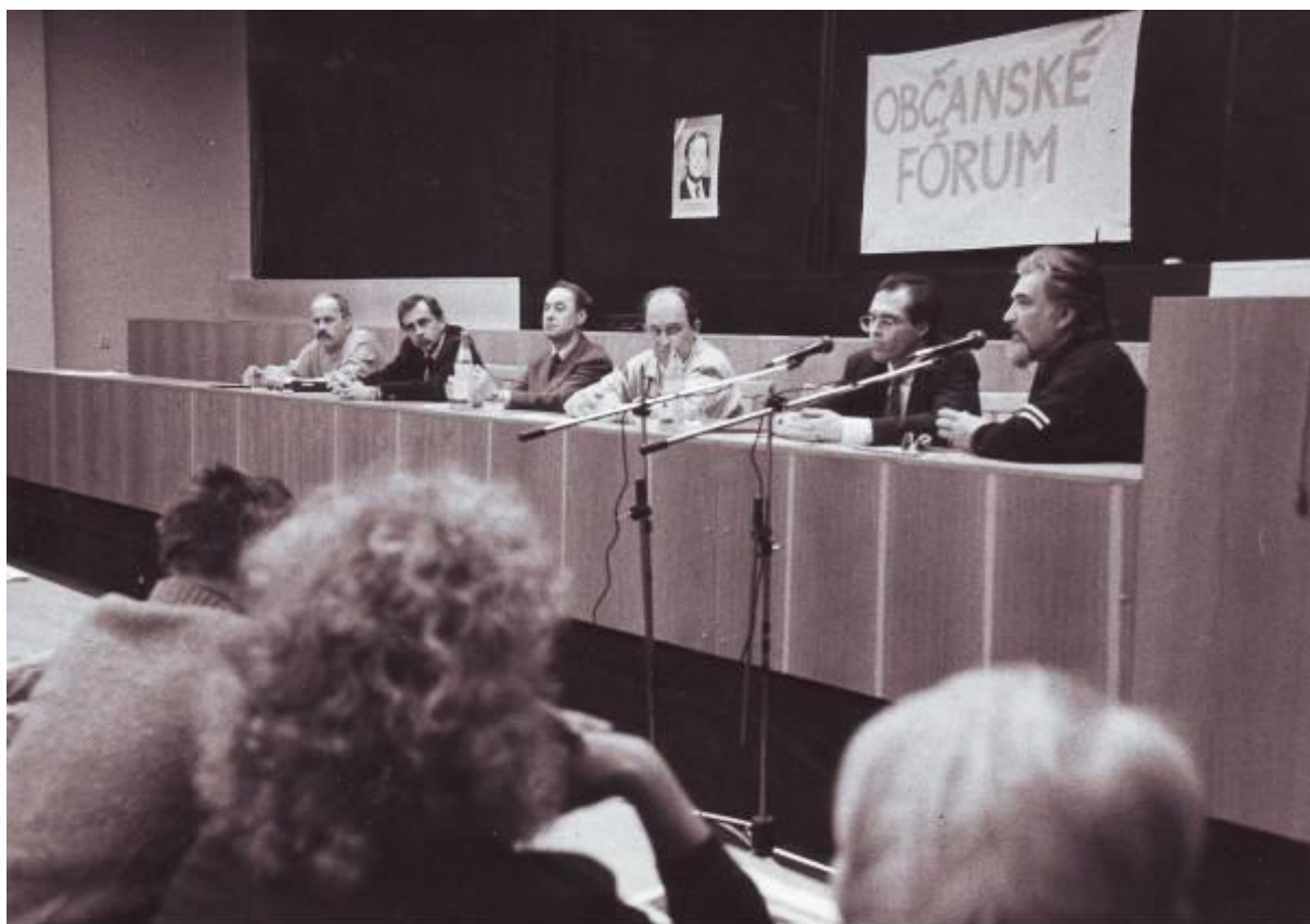
Fotografie z "Dialogu" 13. 12. 1989 - pohled na předsednictvo.