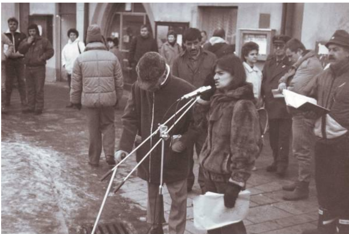
Fotografie z odpolední demonstrace 27. 11. v Tachově - informace a rozmnožené materiály přiváželi studenti.