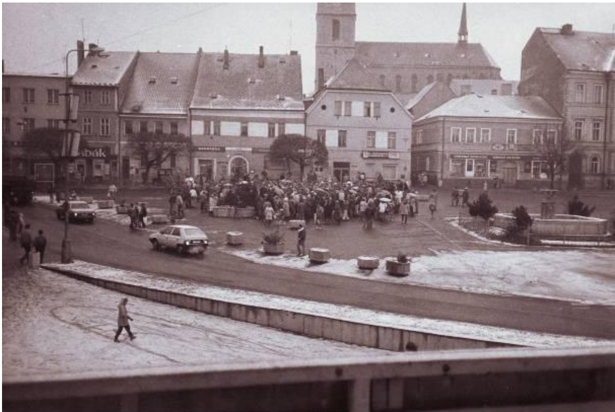
Na fotografii vidíme demonstraci 24. 11. 1989 na náměstí v Tachově. Informace byly zkreslené, lidé měli ještě strach. Oprávněně - policie situaci monitorovala - hlášení o demonstraci si můžete přečíst ve sborníku SECURITAS IMPERII 6/III, který je k půjčení v městské knihovně.