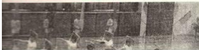
Tachovská Jiskra 8. 12.

V pondělí se uskutečnilo další protestní shromáždění