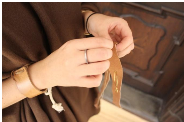
Z Mezinárodního dne archeologie

V rámci prezentace města byla nadále zdarma zpřístupněna virtuální prohlídka muzea na www.virtualtravel.cz .