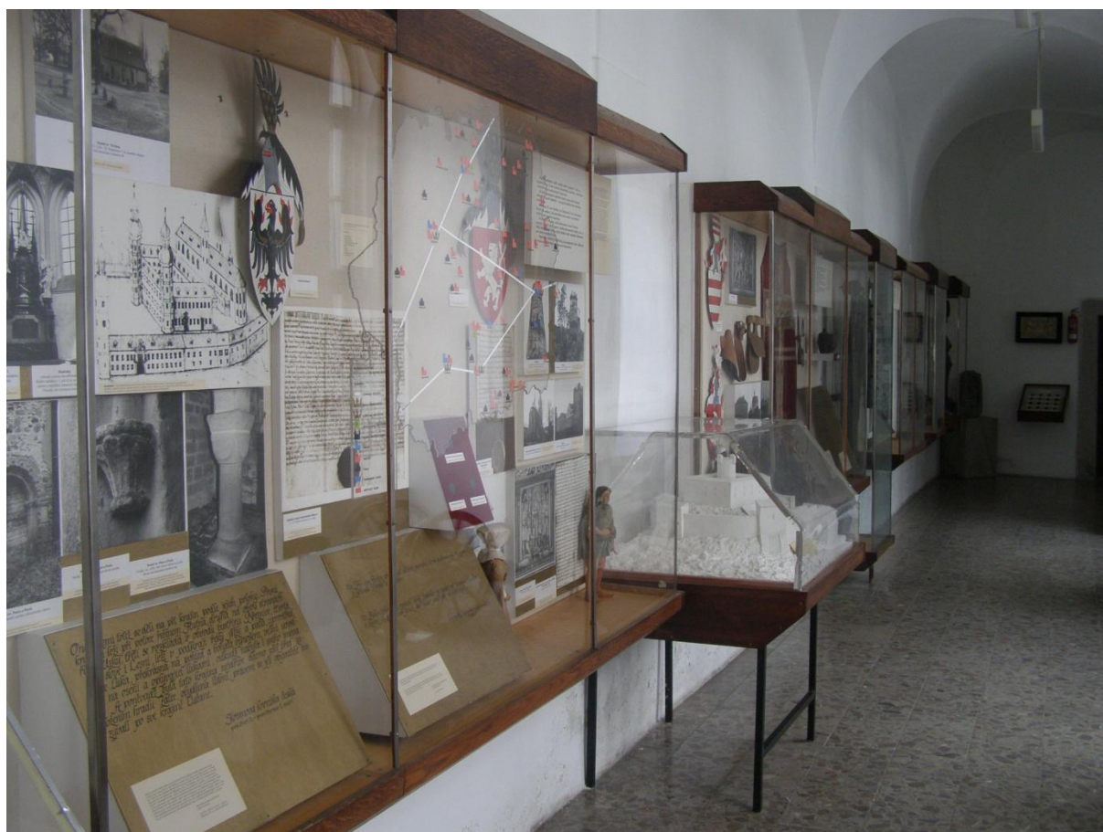
Pohled do staré, již demontované, expozice historie v přízemí muzea

Muzeum v r.2019 neposkytovalo žádné informace na základě zákona č.106/ 1999