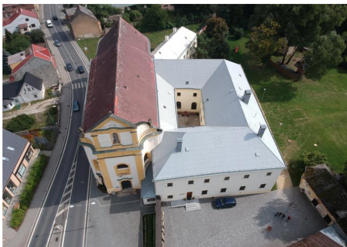
pohled na muzeum z dronu